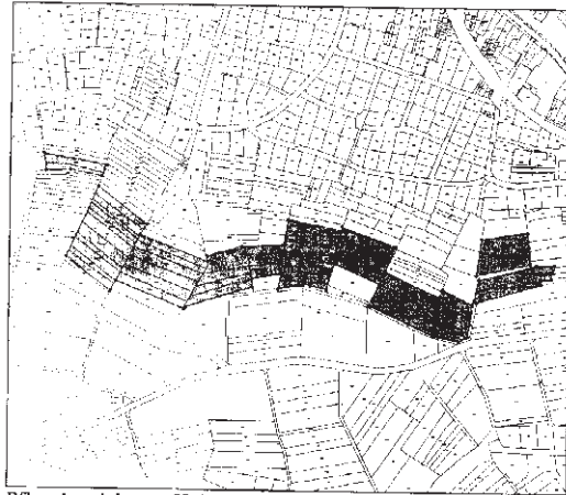
Pflegebereiche am Holzberg

Sollten wir nichts Gegenteiliges hören gehen wir auch weiterhin von ihrer Zustimmung für diese Maßnahmen aus. Bei Fragen wenden Sie sich an den Landschaftspflegeverband Miltenberg e.V. (Telefon 09371/501300).